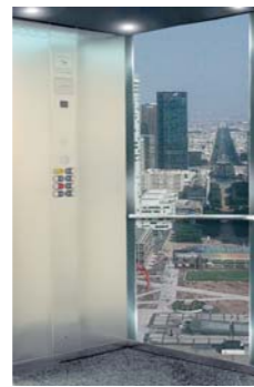
1. C700. X12 Inoxidable brillo espejo 2. C700. X12 Inox. esmerilado AISI 316 3. V700. X11+Y02 Cristal